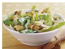
سالاد سبزر (محتوی مرغ)

سالاد جزو محصولات است که به نسبت فرهنگ و ذائقه مردم هر کشور از تنوع بسیار برخوردار بوده و در کلیه کشورها انواع مختلف آن چه به شکل سنتی و چه به شکل صنعتی تولید و مصرف میشود. متداولترین و رایج ترین سالادها در دنیا عبارتند از سالاد سبزر (محتوی مرغ)، سالاد آمریکایی (اسفناج)، سالاد روسی (سیب زمینی / نوعی اولویه)، سالاد میوه و سالاد پاستا که نامگذاری آنها بر اساس مواد متشکله و بعضا مبدا پیدایش آنها می باشد.