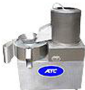
یک نمونه از دستگاه پوست گیر و خرد کن هویج