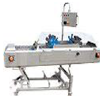
یک نمونه دستگاه برش سر و ته هویج