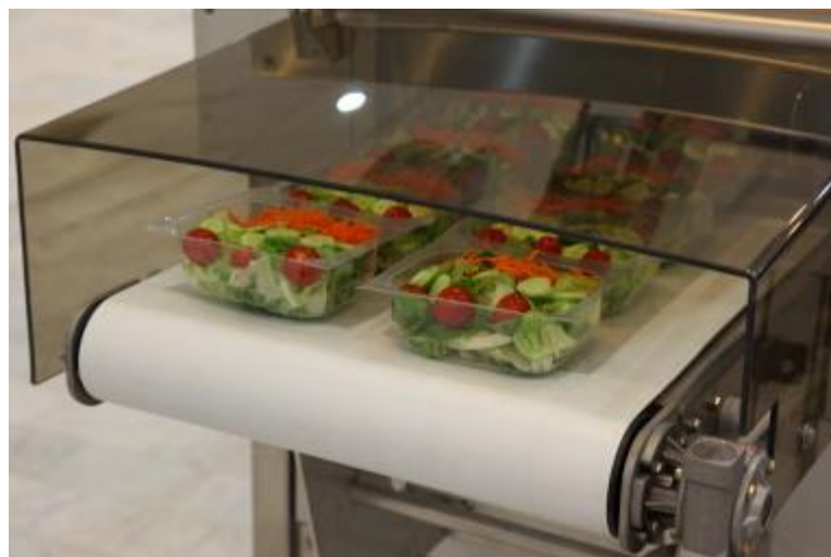
تصاویری از دستگاههای آماده سازی، شستشو، خرد کن و بسته بندی سالاد