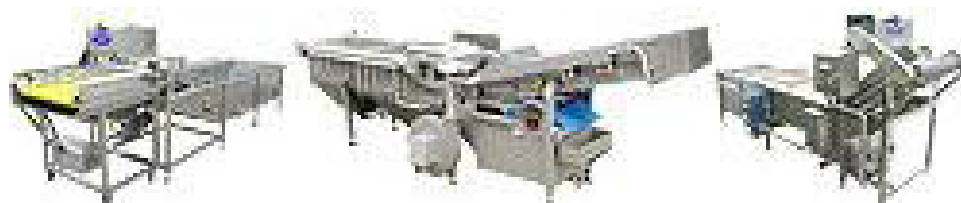
تصویری از سه نمونه واحد شستشو جهت انواع سبزیجات برگی و غیر برگی و میوه جات