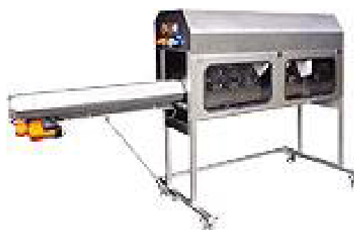
تصویری از یک نمونه دستگاه پوست کن مناسب برای خیار و هویج