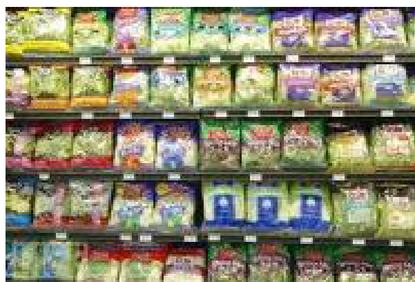
تصویری از یک فروشگاه - قسمت عرضه سالاد های بسته بندی شده