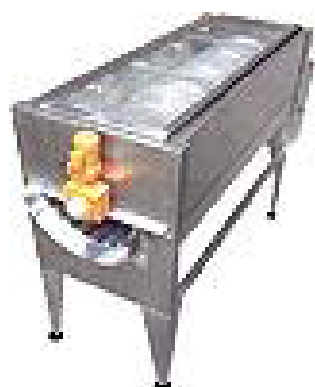
تصویری از یک نمونه دستگاه پوست گیر سایشی هویج