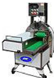
یک نمونه از دستگاه خرد کن سبزیجات